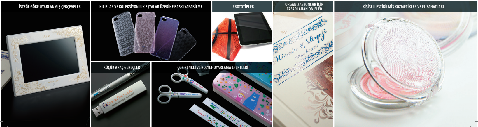
ÇOK RENKLİ VE RÖLYEF UYARLAMA EFEKTLERİ